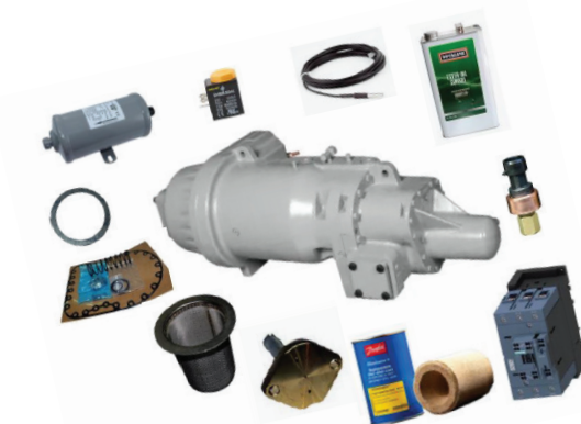
Zestaw do sprężarek 06T