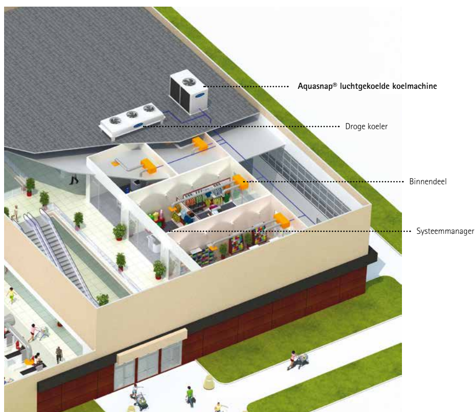
Aquasmart Evolution systeem in winkeltoepassing compleet met regeling