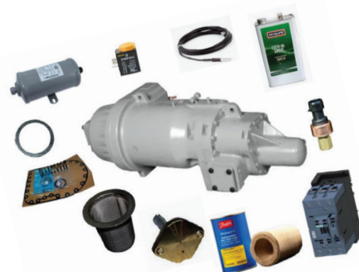
Revisieset voor 06T compressoren